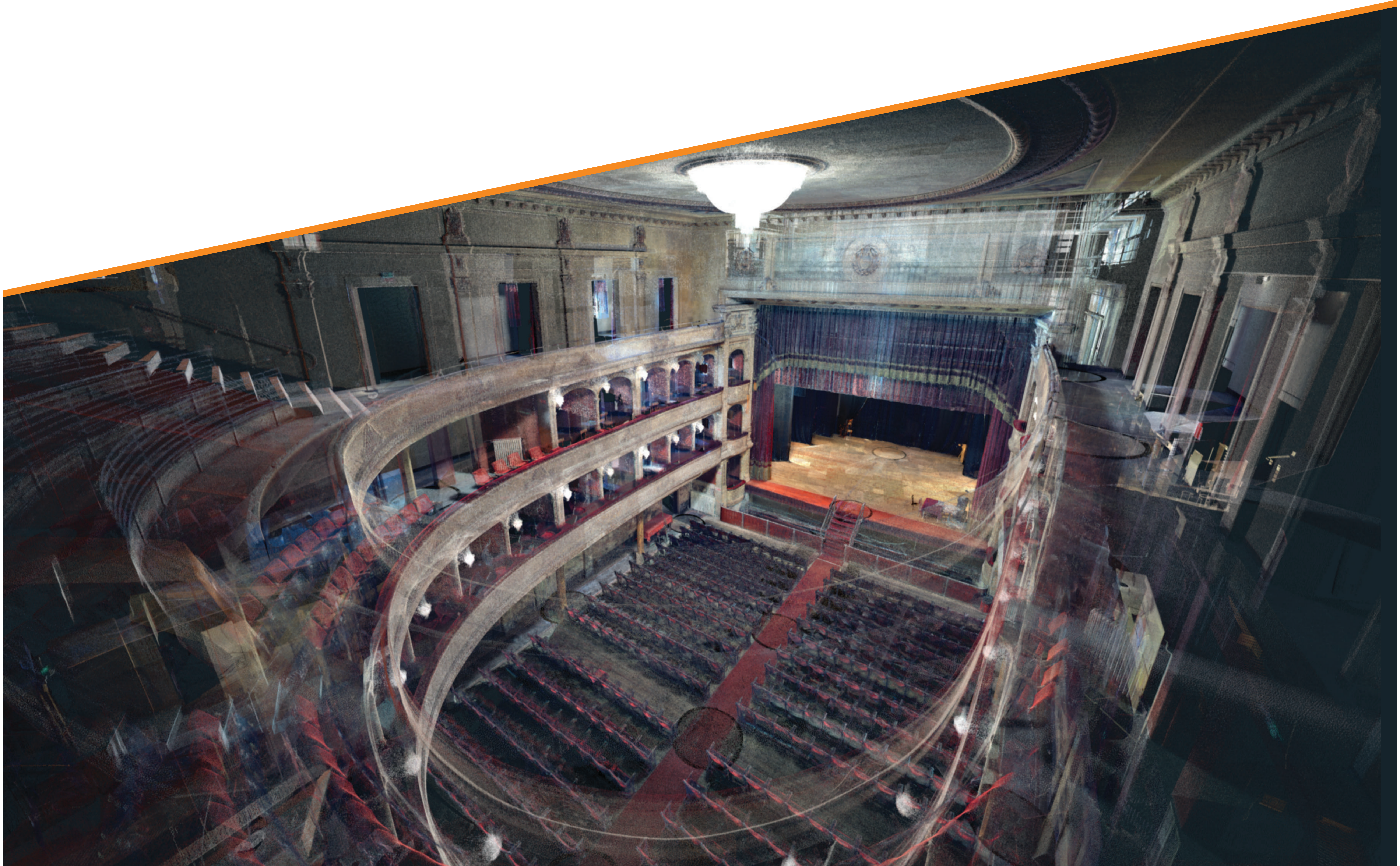
Ricostruzione digitale tridimensionale del Teatro