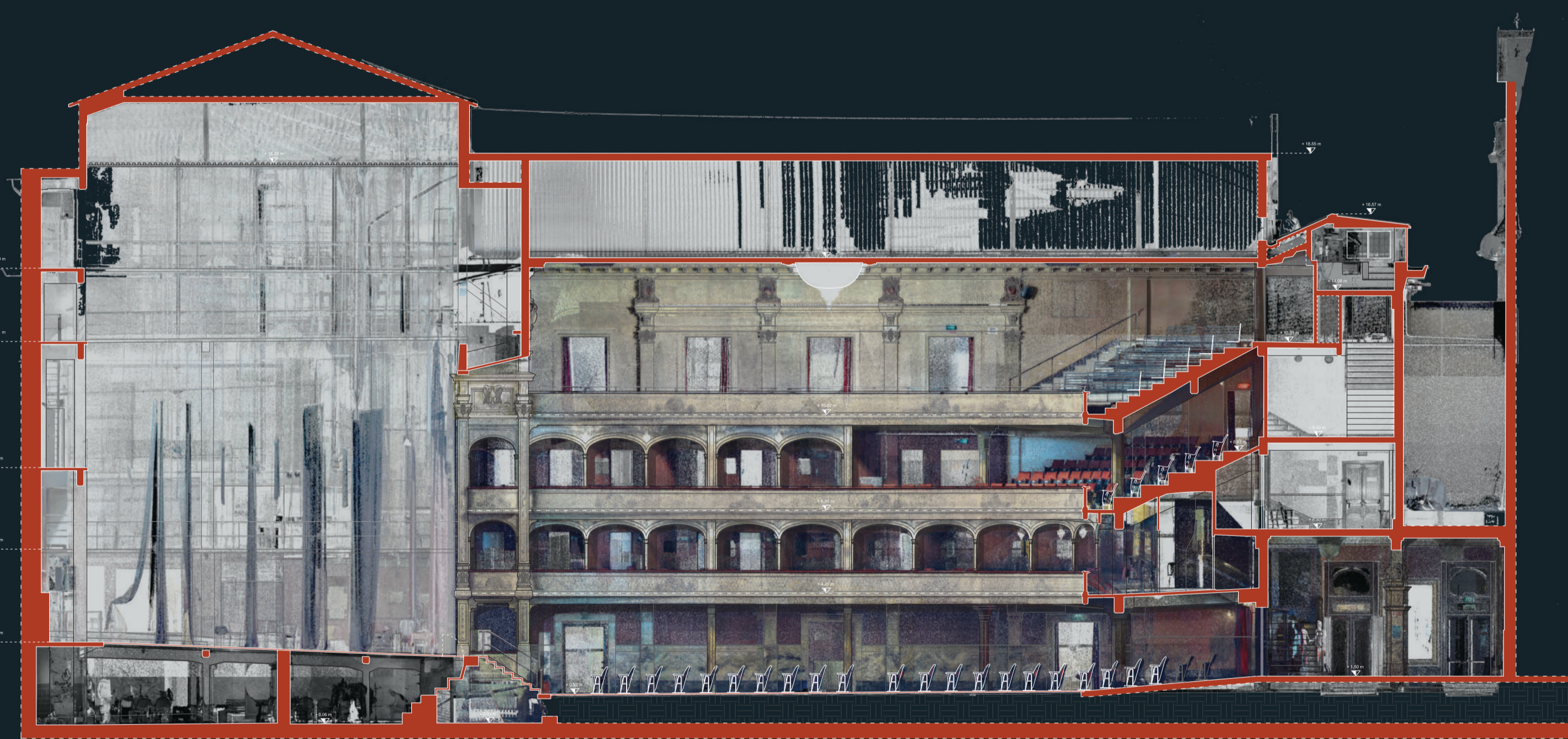
Disegno CAD stato di fatto - sezione longitudinale